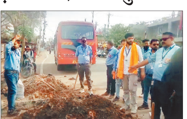
गया कि खुदाई की अनुमति भी निगम से नहीं ली गई है। मौके पर पहुंचे निगम ने जांच की तो पाया कि नल फिटिंग के लिए 7 फीट गहरा

बिलासपुर। आर के पेट्रोल पंप से रामायण चौक होते हुए रफटा चौक तक हाल ही में डामरीकरण कर नई सड़क बनाई गई है। इसी सड़क की कार्रवाई को कुछ लोगों ने का पब्लिक जानबूझकर खोद में खीफ नहीं दिया गया। रथा नी य लोगों ने निगम से इसकी शिकायत करते हुए बताया कि चांटीडीह जाने वाले मार्ग के पास संतोषी मंदिर के पास सड़क की खुदाई की जा रही है। इसकी जानकारी ली गई तो पाया