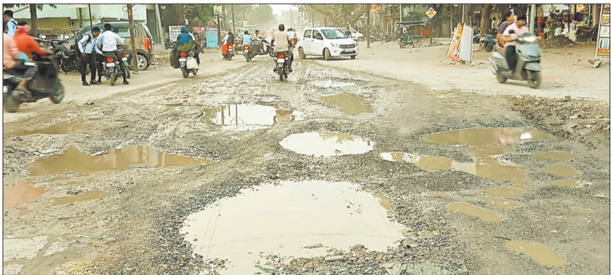
हरिभूमि न्यूज बिलासपुर

सरकंडा में अशोकनगर चौक से कुर्मी छात्रावास तक बन रहा सड़क नाली का काम लोगों के लिए परेशानी का सबब बनता जा रहा है। पिछले करीब दो महीने से सड़क के दोनों ओर नाली निर्माण का काम चल रहा है, मगर रफ्तार इतनी सुस्त है कि आमजन को रोजाना कीचड़, धूल और गड़ों का सामना करना पड़ रहा है। नाली खुदाई के बाद मलबा और गीली मिट्टी सड़क पर ही छोड़ दी जा रही है। हालात ऐसे हैं कि दोपहिया वाहन सामान पड़े और पैदल चलना जोखिम भरा हो गया है।