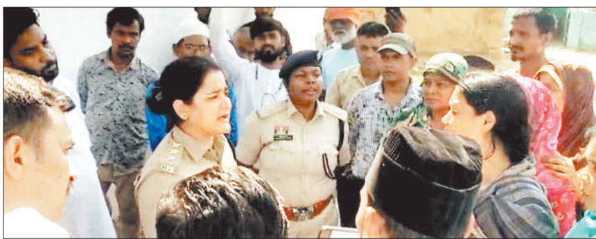
रतनपुर के ग्राम पेण्डरवा के ग्रामीणों से मामले की जानकारी लेती पुलिस।