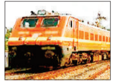
गाड़ी संख्या 68745

गई है, उपरोक्त तिथि में यह गाड़ी अपने निर्धारित समयानुसार चलेगी। गाड़ी संख्या 68738 बिलासपुर-रायगढ़ मेमू, गाड़ी संख्या 68736 बिलासपुर-रायगढ़ मेमू, गाड़ी संख्या 68735 रायगढ़-बिलासपुर मेमू को 4 से 7 अप्रैल तक रिस्टोर किया गया है, जो उपरोक्त तिथि में यह गाड़ी अपने निर्धारित समयानुसार चलेगी। गाड़ी संख्या 68746 रायपुर-गेवराड मेमू 3 से 6 अप्रैल तक